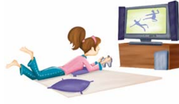
3 ...playing video games