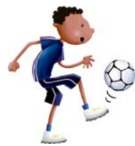
1 ...playing football