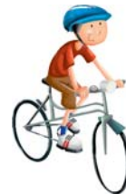
6 ...riding my bike